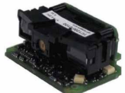
TC1200 SCAN ENGINE MODELL