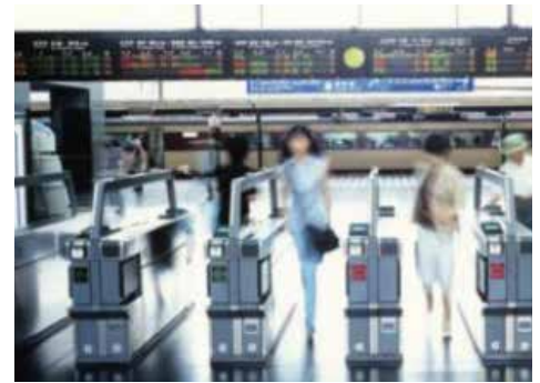
Zugangskontrolle und Ticketbuchung